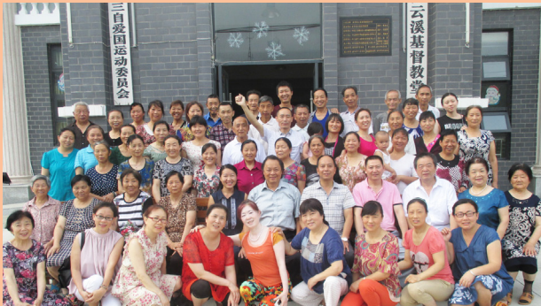
左：四川省綿陽市鹽亭縣教會