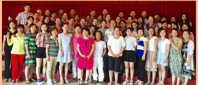
右：海南省海口市教會